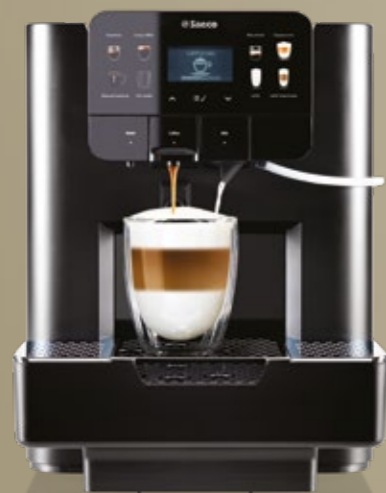
AREA OTC HSC Lavazza Blue®*