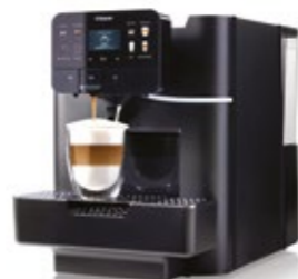
Area OTC HSC