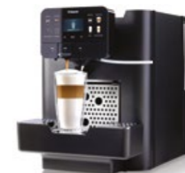
Area OTC HSC