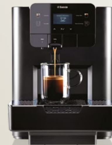
AREA Focus Nespresso®*

Attacco rete idrica opzionale (con kit rete idrica)