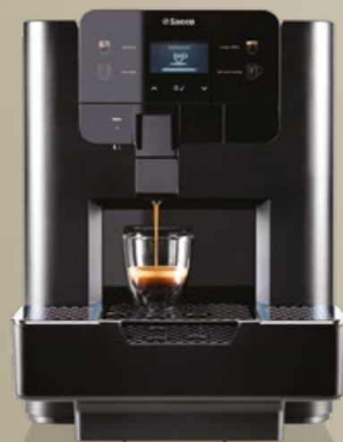
AREA Focus Lavazza Blue®*

Attacco rete idrica opzionale (con kit rete idrica)