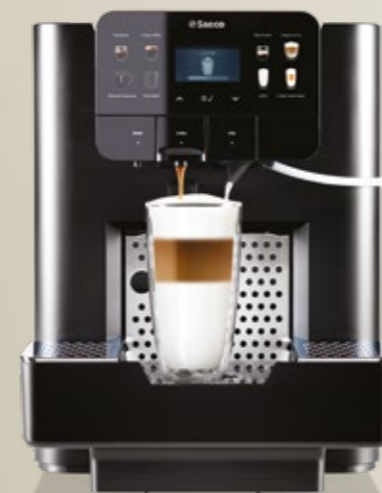
AREA OTC HSC Nespresso®*

Attacco rete idrica opzionale (con kit rete idrica)