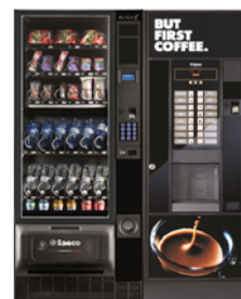
Artico S + Oasi 400